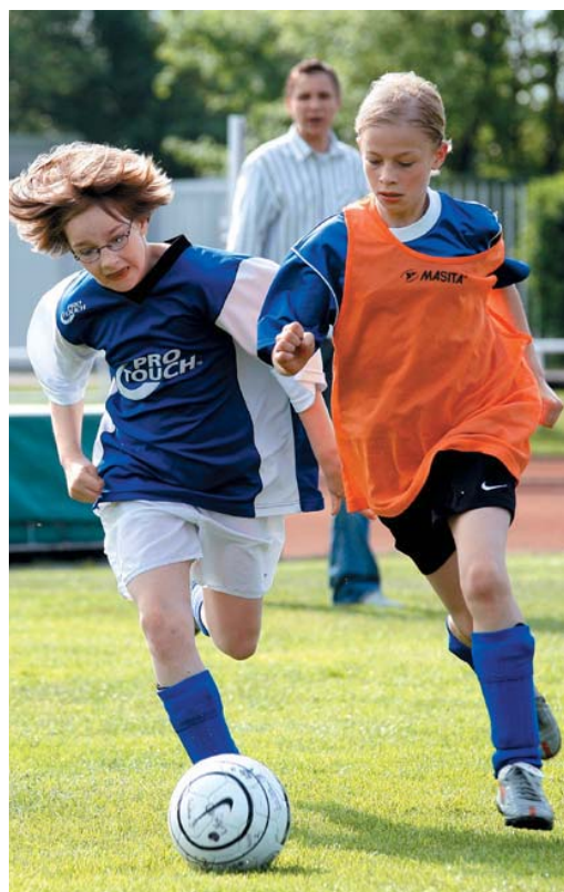
Mädchen beim FC Internationale: Solidarität ist einfach geil

Den größten Anfall von Fußball-Fieber hat der Konzern Continental Teves zumindest in Deutschland schon hinter sich: die Spiele um den Cont Team Cup. Dabei spielen alle weltweit 72 Continental-Standorte gegeneinander, sei es in Männer- oder Frauen-Teams. Dabei sind Kicker der verschiedensten Klassen auf dem Feld – bis hin zu Spielern aus der Landesliga. Glück und Können verhalf den Metallern des Standorts Gifhorn zur deutschen Meisterschaft. Bis ins Europa-Endspiel hat es dann nicht gereicht. Vielleicht klappt es ja beim nächsten Mal?