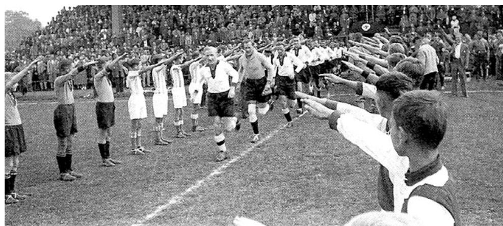
Hitlergruß zum Anpfiff: Die Nazis instrumentalisieren den Sport für ihre Ideologie